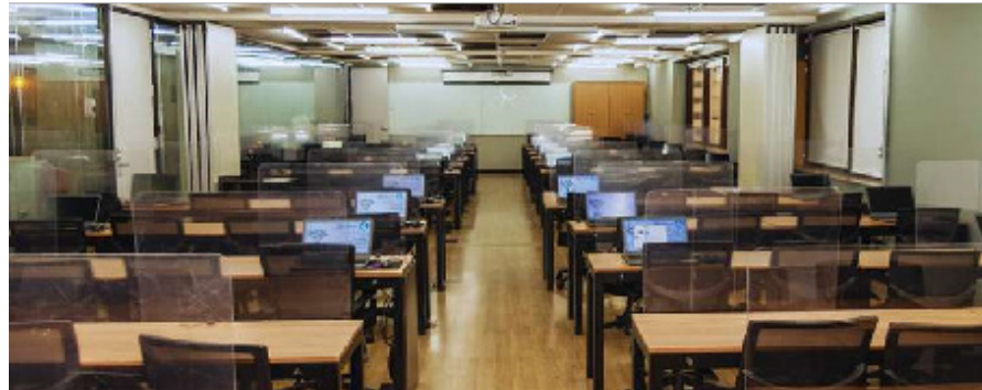
Área para Networking

A parceria LABDATA e GoWork traz para o ecossistema do coworking, um núcleo de educação executiva, onde pesquisadores, empreendedores e estudantes contribuem para a maximização dos resultados criando um ambiente de busca por conhecimento, sintetizado em muitos eventos, hackathons, aulas de alto nível e amplo espaço para networking. Localizado na Avenida Paulista , nossos laboratórios contam com equipamentos de última geração, conforto e segurança para nossos alunos e professores.